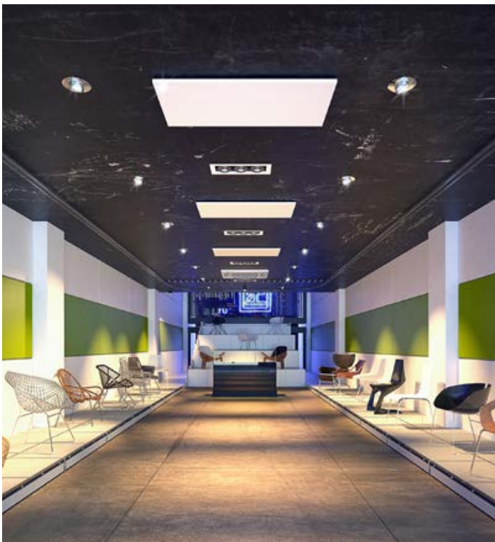
POSA A SOFFITTO

Funzionano mediamente tra i 15 e i 20 minuti all'ora con un risparmio energetico fino al 50% rispetto al riscaldamento tradizionale.