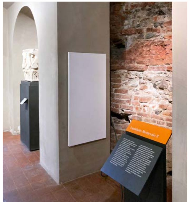
SPAZIO MUSEALE DI PALAZZO MADAMA - TORINO

Facili e veloci da installare possono essere montati a parete, soffitto o controsoffitto, utilizzando gli accessori di montaggio in dotazione: dopo averli collegati all'alimentazione elettrica sono pronti per funzionare. Con il loro design elegante arredano ogni ambiente.