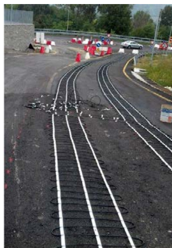
Ospedale di Bra - Accesso al pronto soccorso