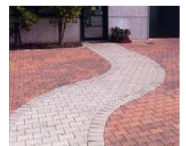
AUTOBLOCCANTE + SABBIA + CEMENTO