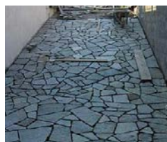
PIETRA + CEMENTO