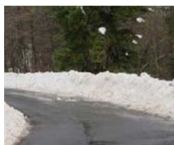
ASFALTO / BITUME