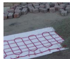
PORFIDO A SECCO, NELLA SABBIA